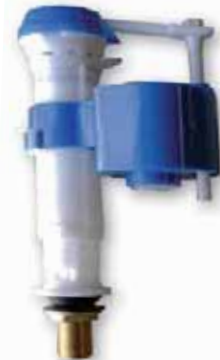
Grifo Flotador Compacto Toma Baja