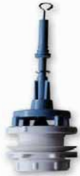
Descargador Fominaya Toma Alta con Base