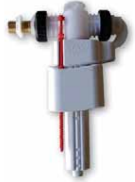
Grifo Flotador T/ Lateral Compacto