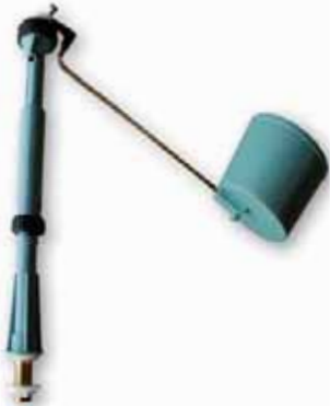
Grifo Flotador Toma Infer. Telescópico con Base