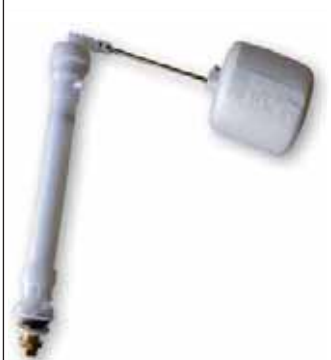
Grifo Flotador Toma Infer. Telescópico