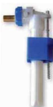
Grifo Flotador T/Lateral Servo