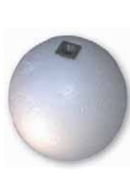
Boya Corcho 3/8 Porespan