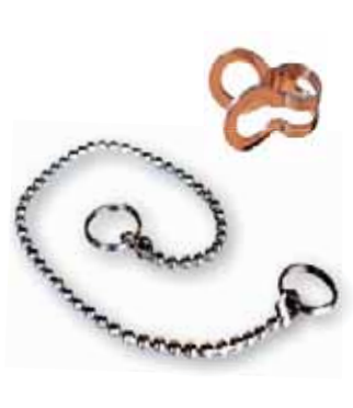
Cadena Bolitas y Enganche