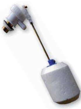
Grifo Flotador SIL T/Alto