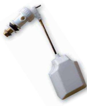
Grifo Flotador T/ Lateral Con Boya