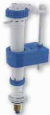
Grifo Flotador Toma Infer. Telescópico SERVO