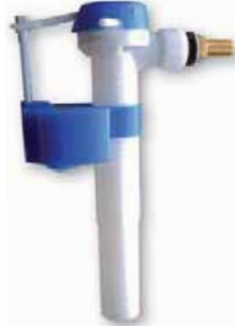
Grifo Flotador Compacto Toma Lateral